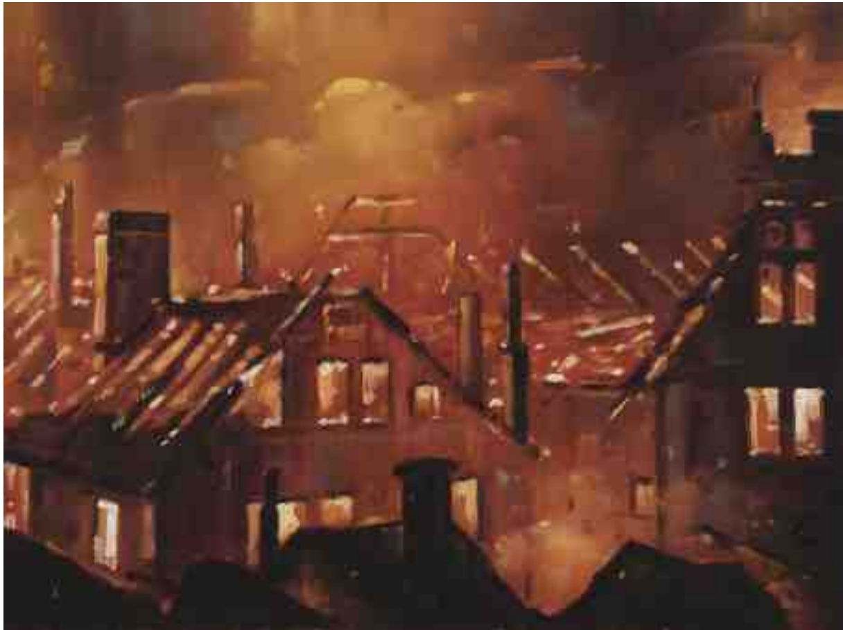
Feuersturm XXVIII Kassel 2017 | Öl/Holz | 18 x 24 cm