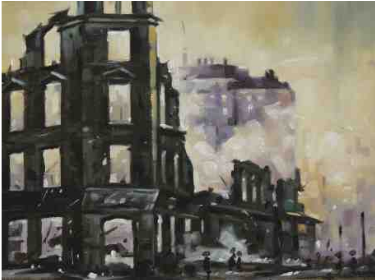
Feuersturm XXV Hamburg 2017 | Öl/Holz | 18 x 24 cm