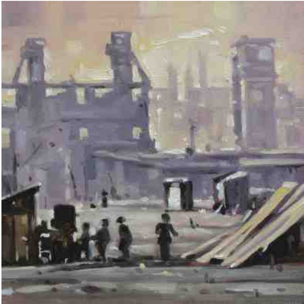
Feuersturm XIX Kassel 2017 | Öl/Holz | 15 x 15 cm