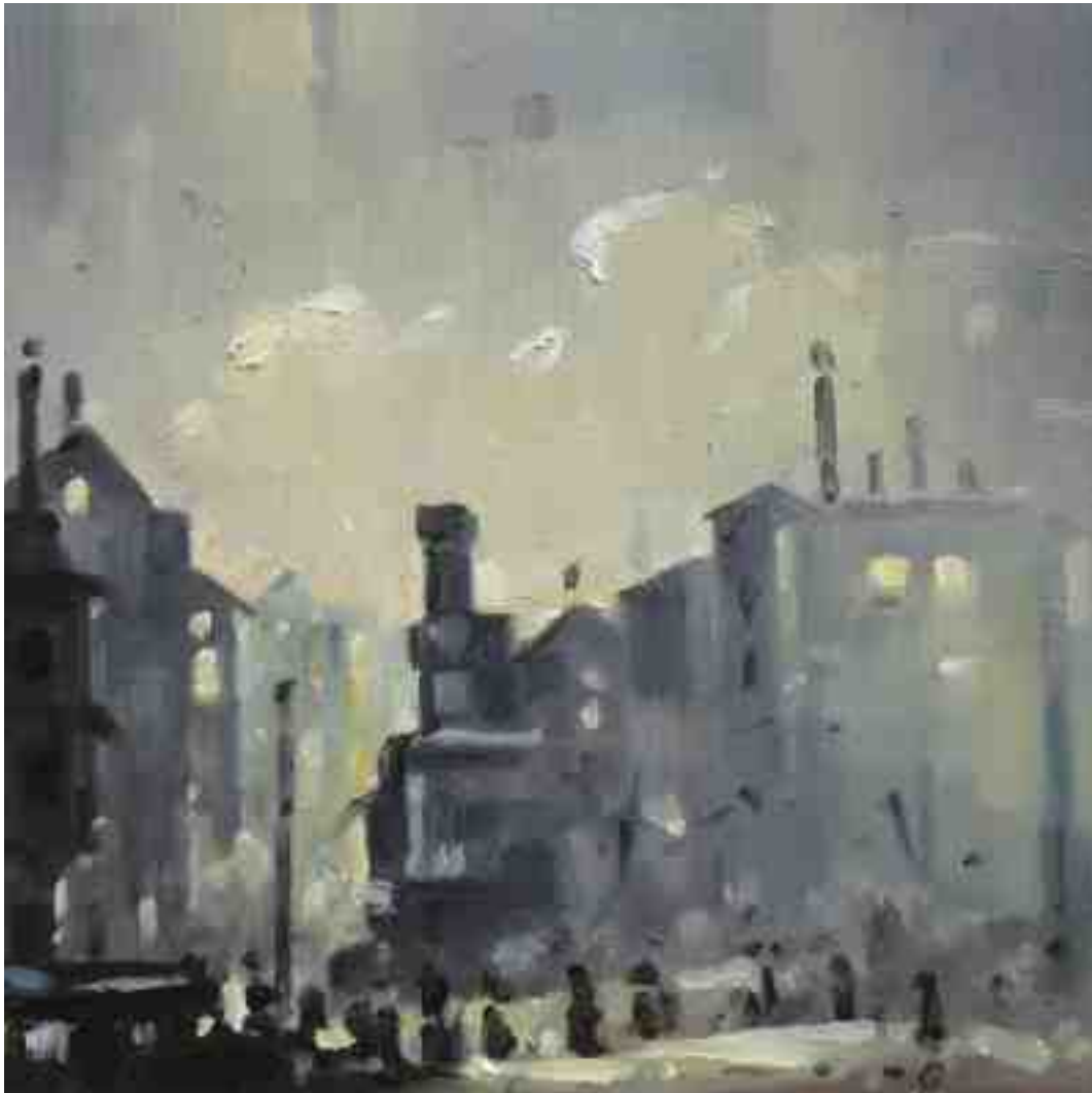
Feuersturm VI Kassel 2017 | Öl/Holz | 15 x 15 cm