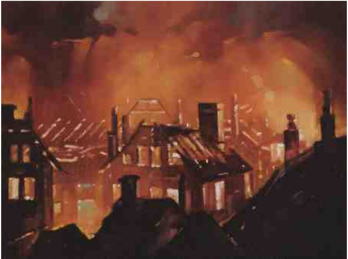
Feuersturm XXX Kassel 2017 | Öl/Holz | 18 x 24 cm