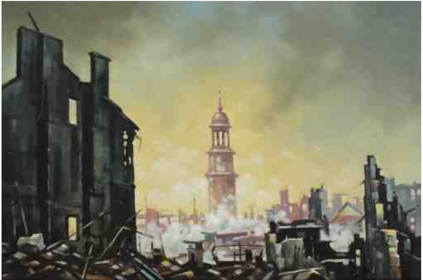
Feuersturm Hamburg 2020 | Öl/Lw. | 40 x 60 cm