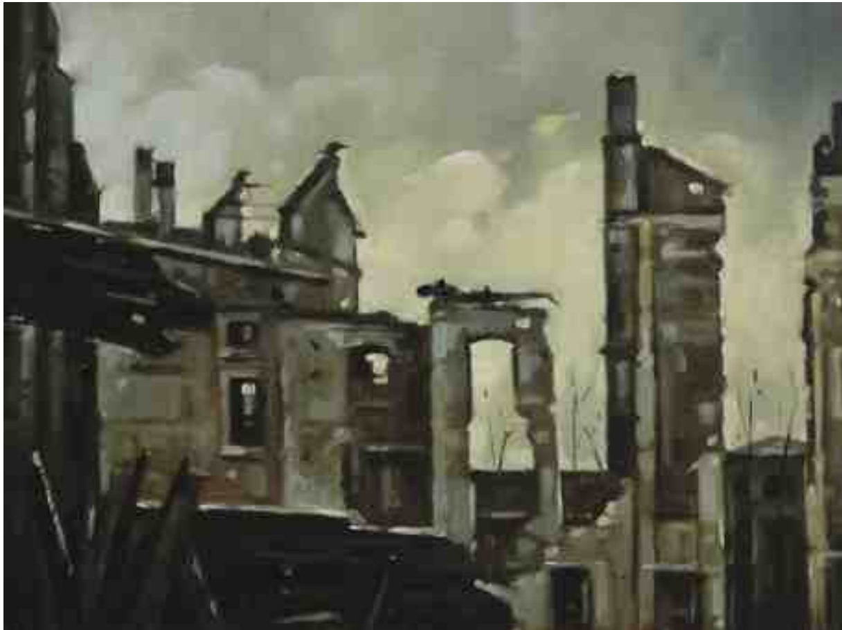
Feuersturm XXIX Kassel 2017 | Öl/Holz | 18 x 24 cm