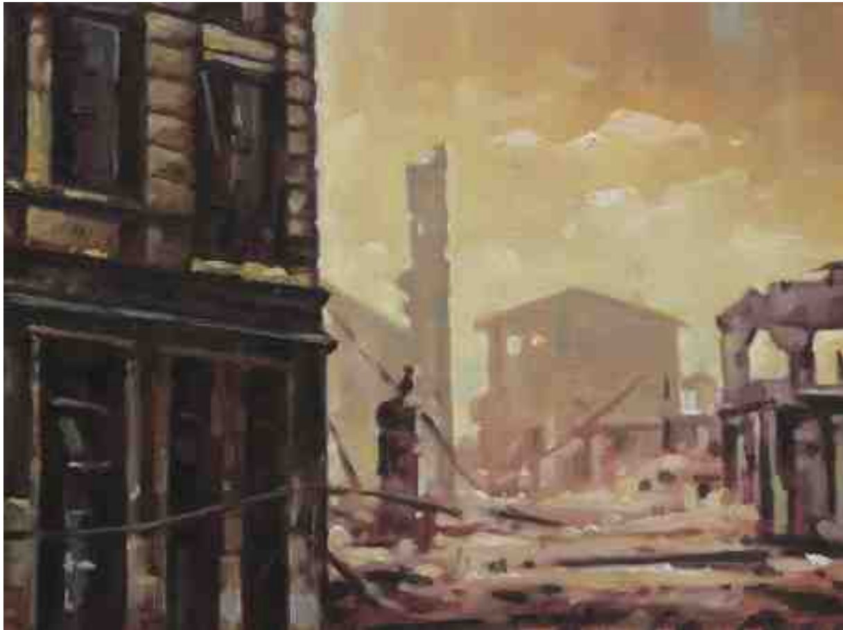
Feuersturm XXXV Guernica 2017 | Öl/Holz | 18 x 24 cm