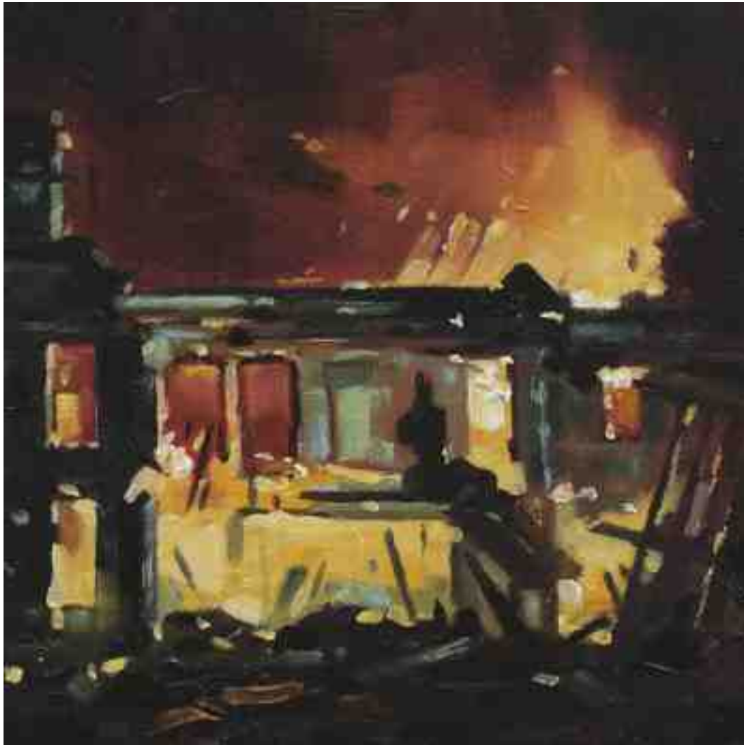
Feuersturm V Kassel 2017 | Öl/Holz | 15 x 15 cm