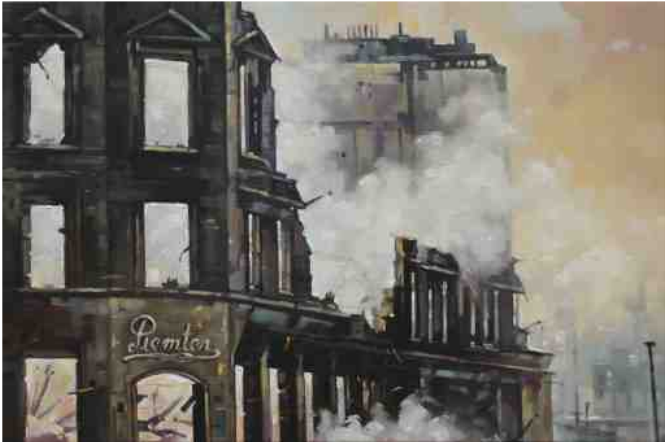
Feuersturm Hamburg 2017 | Öl/Lw. | 40 x 60 cm