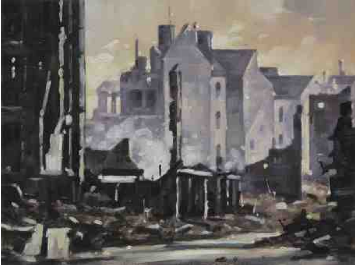
Feuersturm XXXII Hannover 2017 | Öl/Holz | 18 x 24 cm