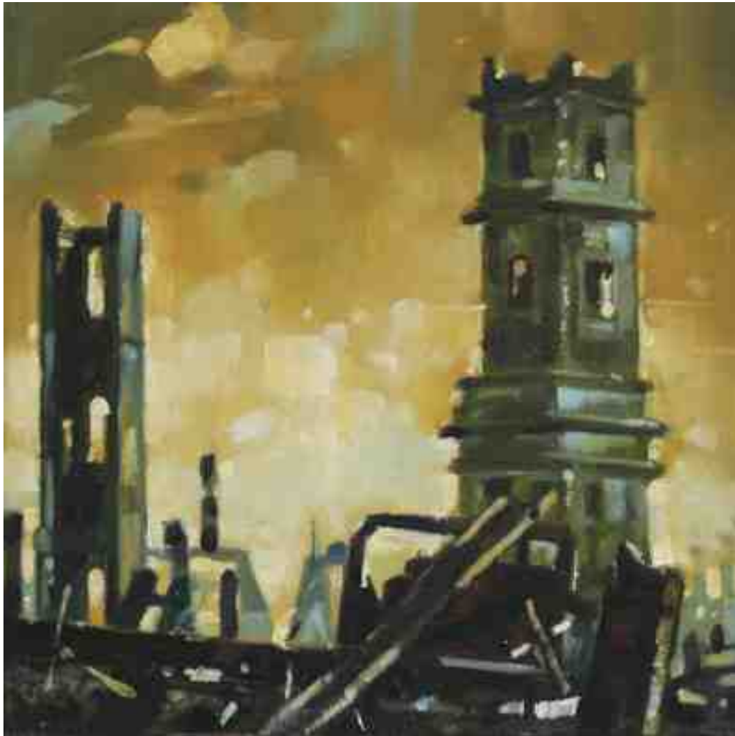
Feuersturm XIV Hannover 2017 | Öl/Holz | 15 x 15 cm