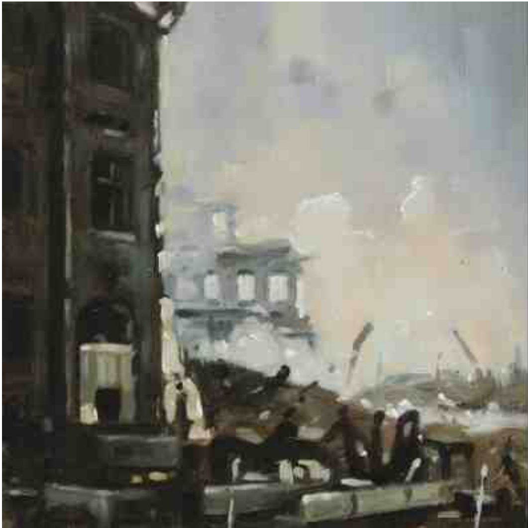
Feuersturm XVIII Kassel 2017 | Öl/Holz | 15 x 15 cm