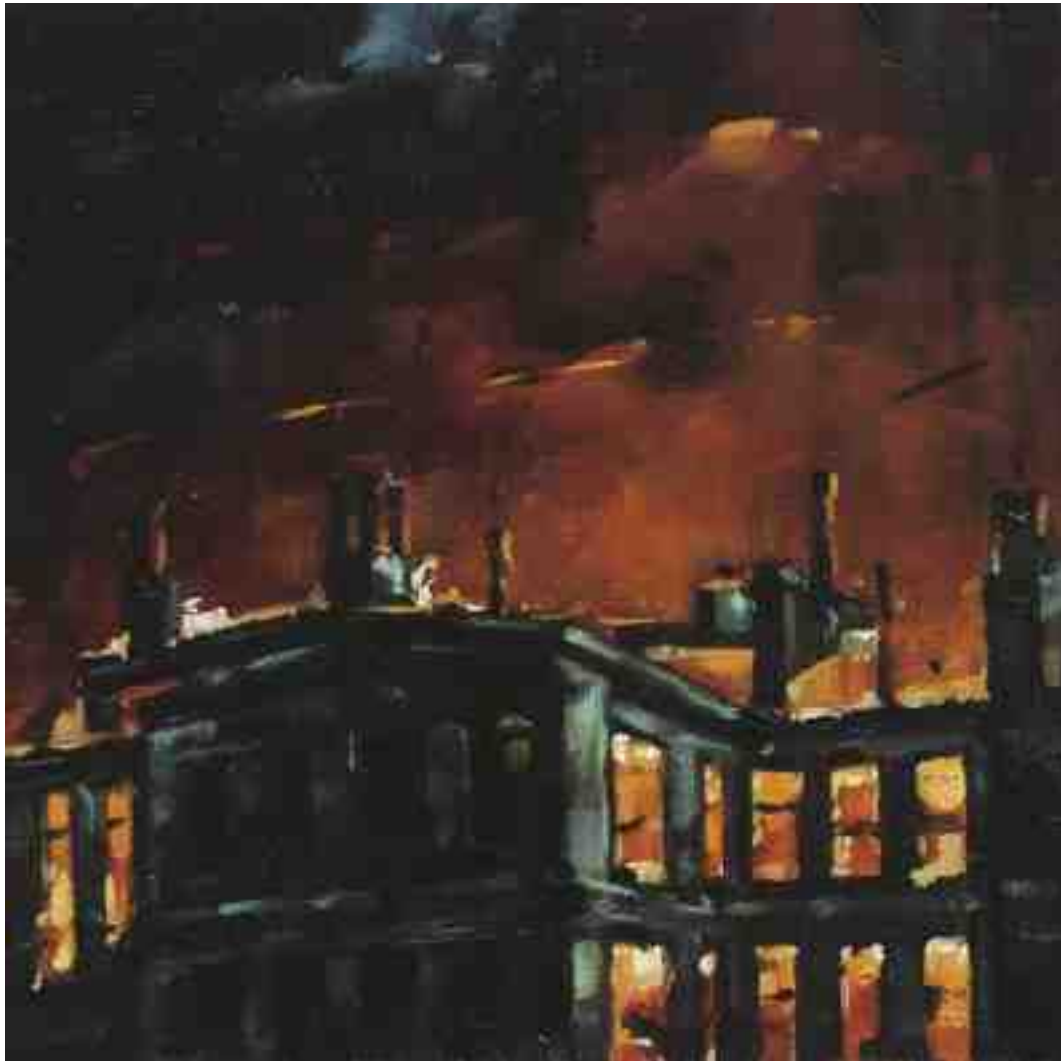
Feuersturm XI Hamburg 2017 | Öl/Holz | 15 x 15 cm