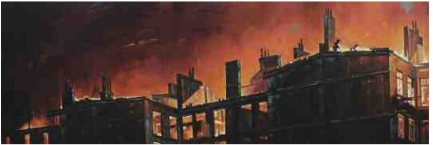
Feuersturm Hamburg 2017 | Öl/Lw. | 40 x 120 cm