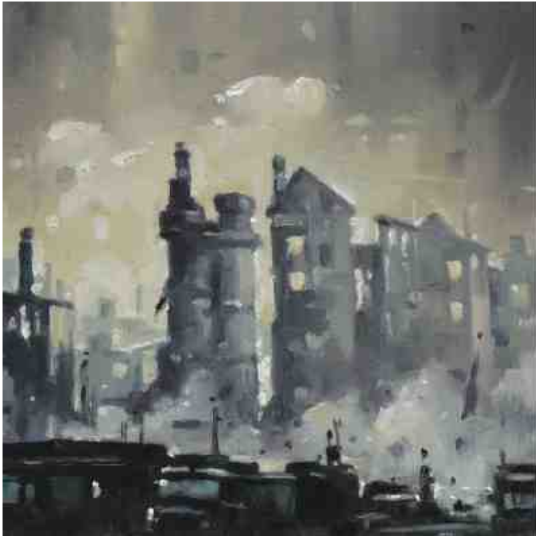
Feuersturm VIII Kassel 2017 | Öl/Holz | 15 x 15 cm