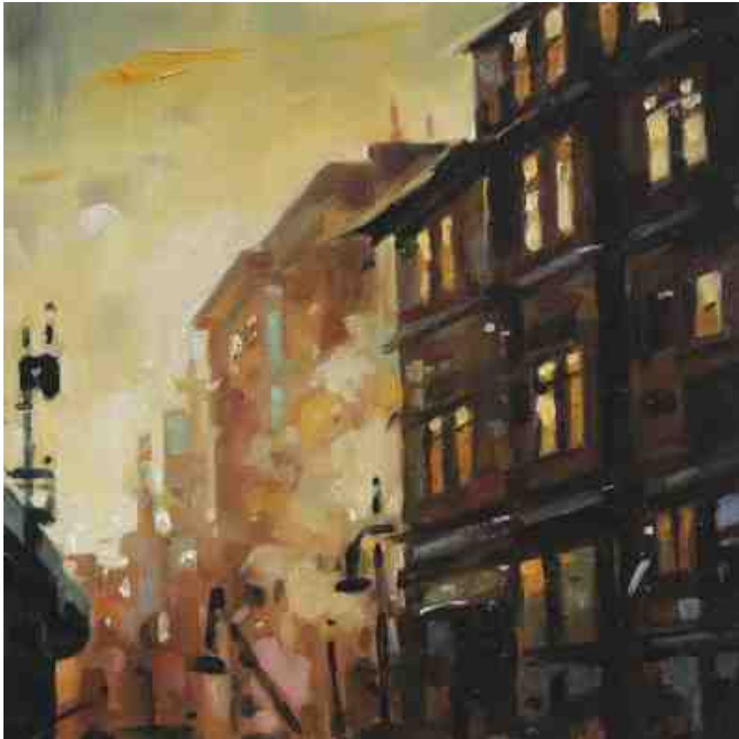
Feuersturm XV Hamburg 2017 | Öl/Holz | 15 x 15 cm