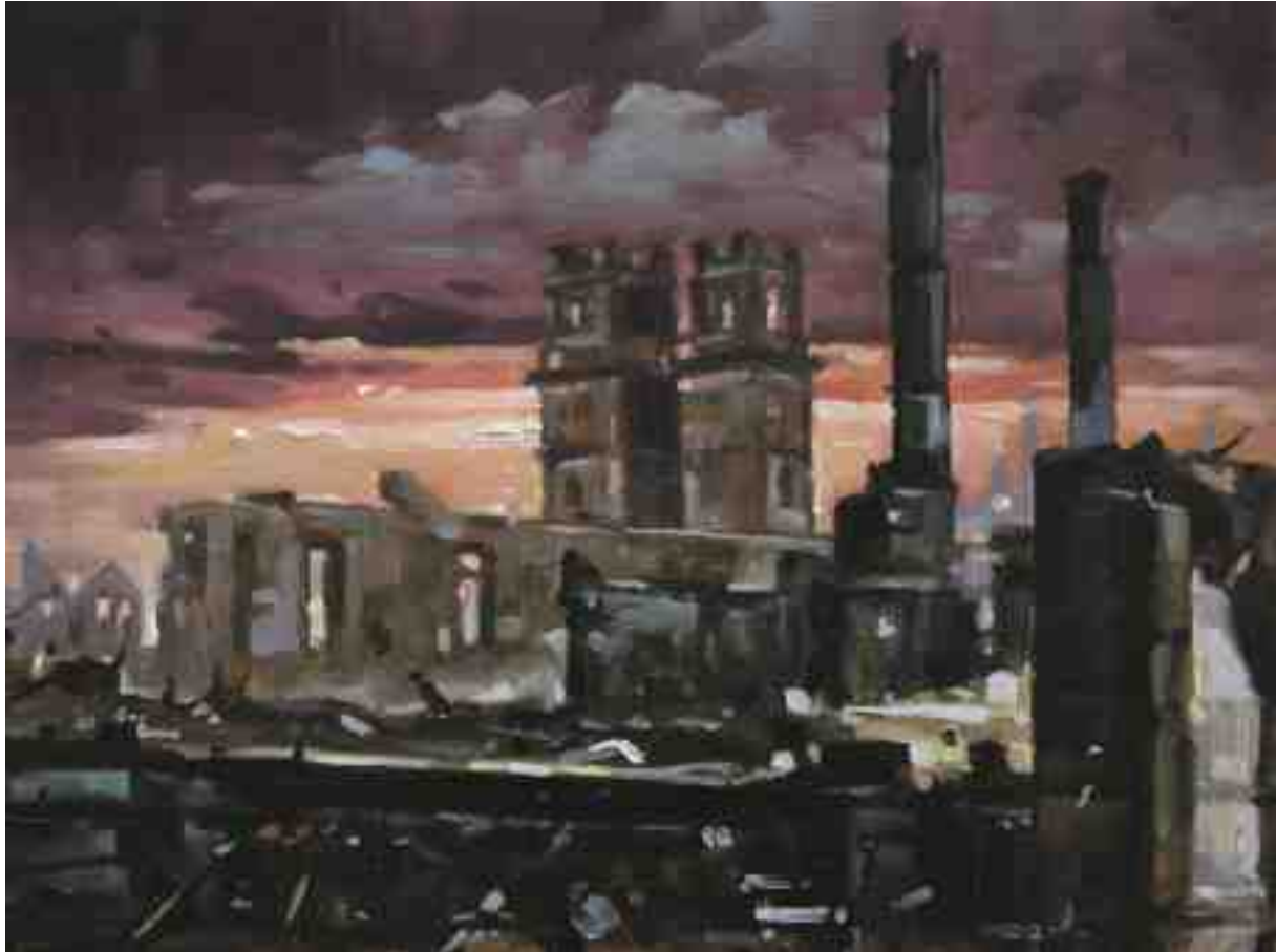
Feuersturm XXIV Kassel 2017 | Öl/Holz | 18 x 24 cm