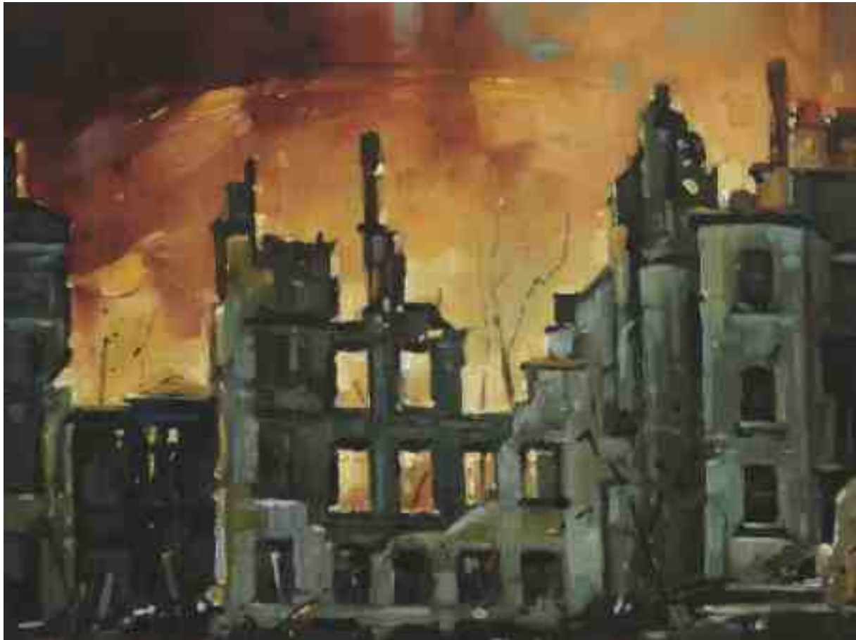
Feuersturm XXI Kassel 2017 | Öl/Holz | 18 x 24 cm