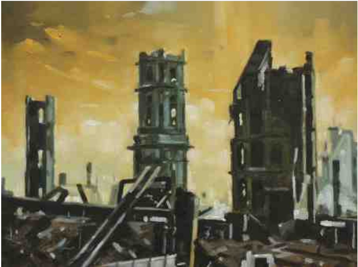
Feuersturm XXII Hannover 2017 | Öl/Holz | 18 x 24 cm