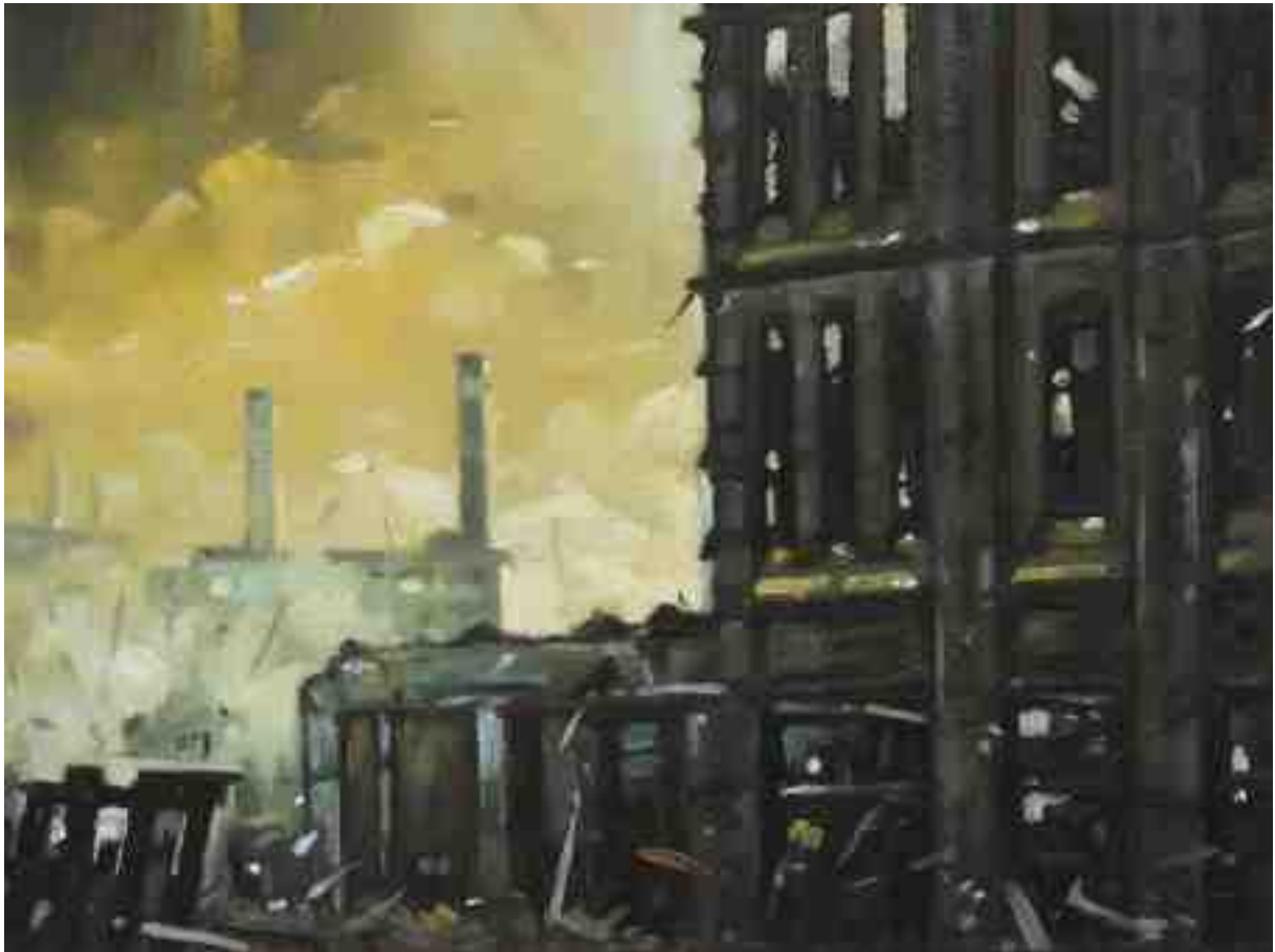
Feuersturm XXXIV Kassel 2017 | Öl/Holz | 18 x 24 cm