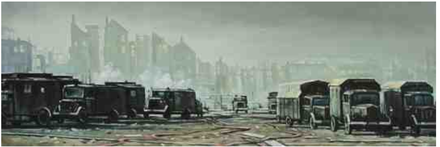
Feuersturm Kassel 2017 | Öl/Lw. | 40 x 120 cm