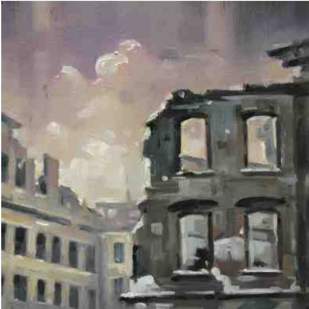
Feuersturm VII Kassel 2017 | Öl/Holz | 15 x 15 cm