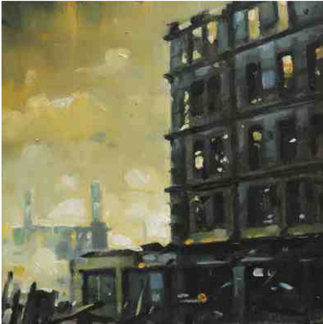
Feuersturm XX Kassel 2017 | Öl/Holz | 15 x 15 cm