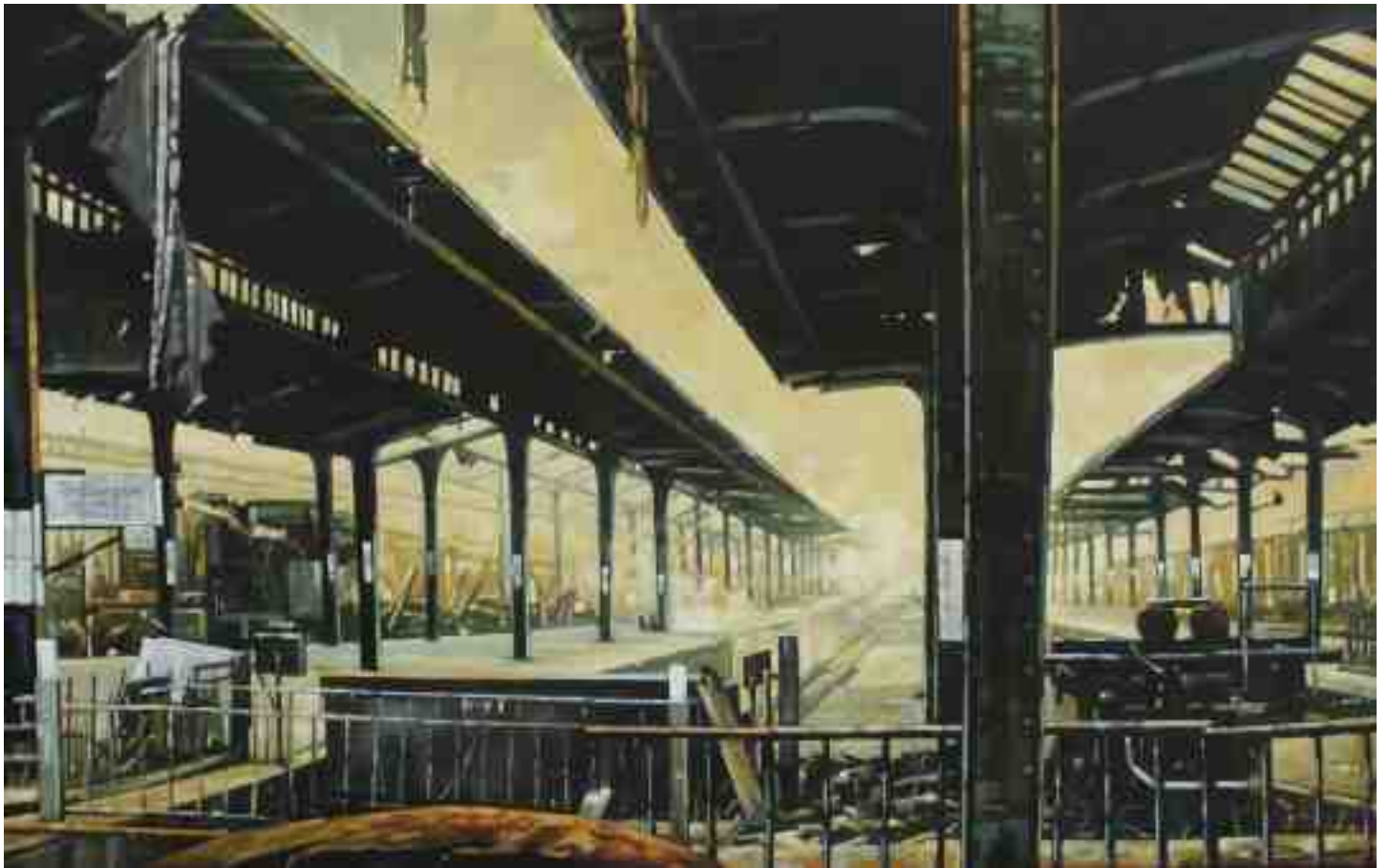
Feuersturm Kassel 2020 | Öl/Lw. | 73 x 116 cm