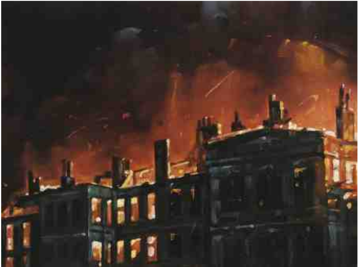
Feuersturm XXVII Hamburg 2017 | Öl/Holz | 18 x 24 cm