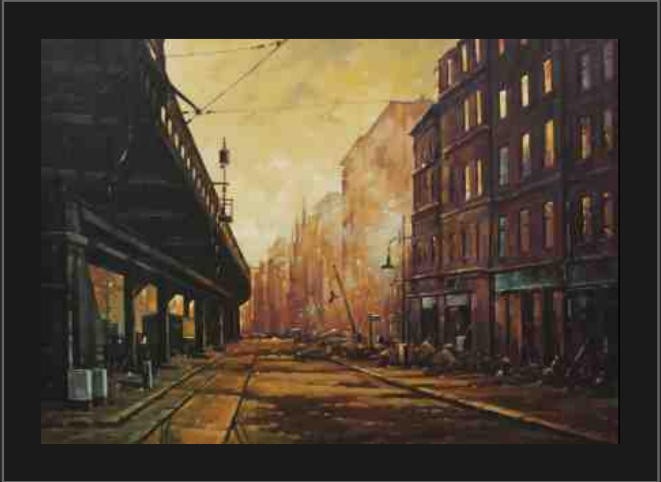
Ralf Scherfose Feuersturm