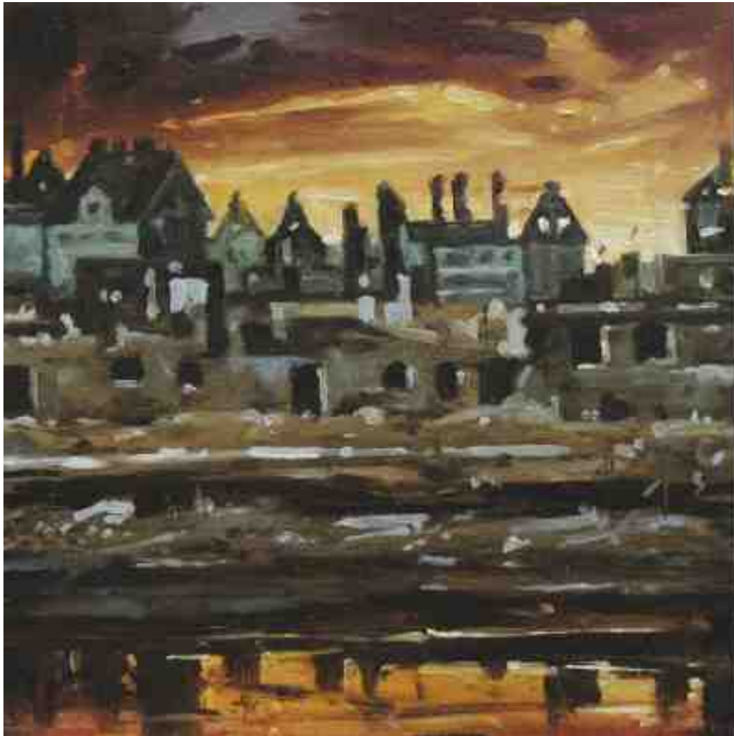
Feuersturm XVI Kassel 2017 | Öl/Holz | 15 x 15 cm