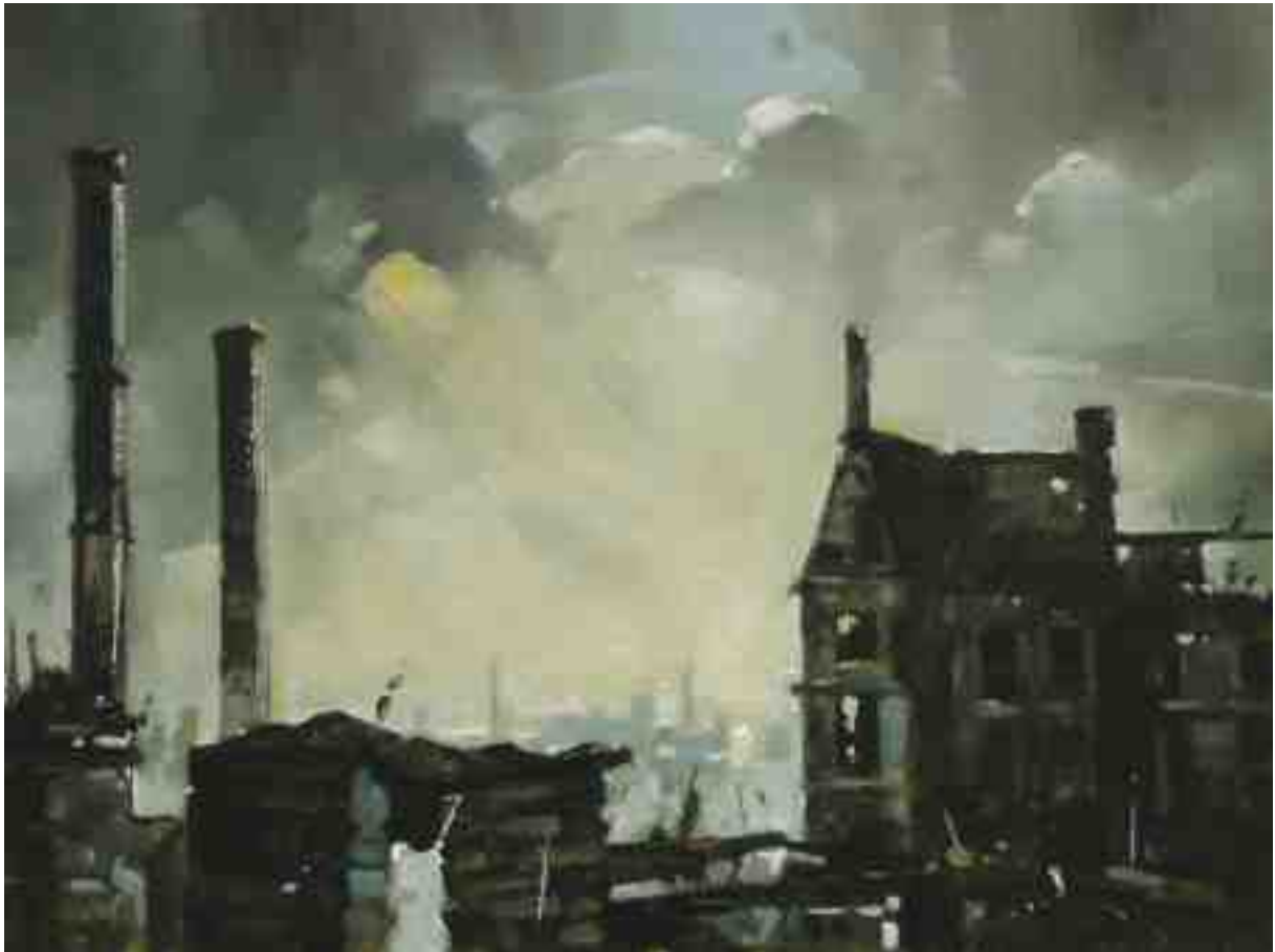
Feuersturm XXVI Kassel 2017 | Öl/Holz | 18 x 24 cm