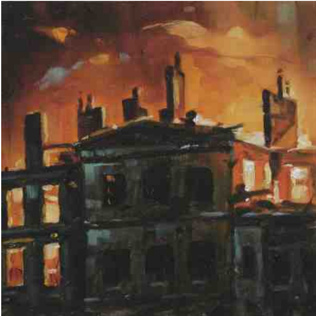
Feuersturm IX Hamburg 2017 | Öl/Holz | 15 x 15 cm