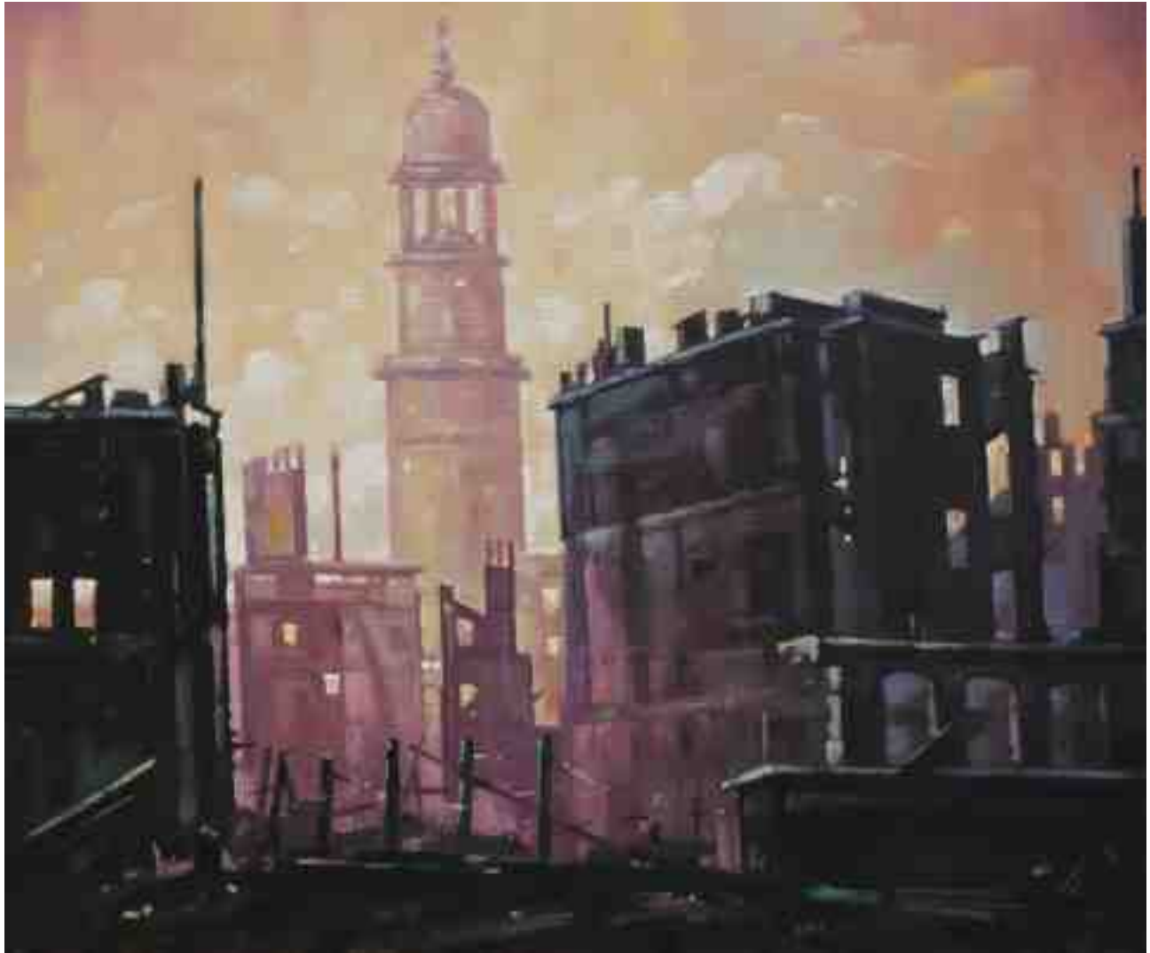
Feuersturm Hamburg 2017 | Öl/Lw. | 50 x 60 cm