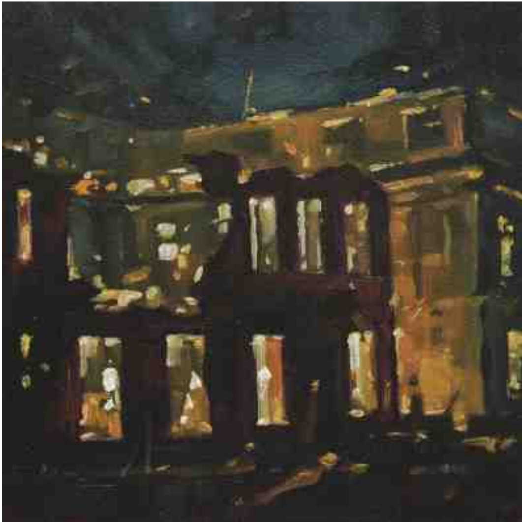
Feuersturm XIII Kassel 2017 | Öl/Holz | 15 x 15 cm