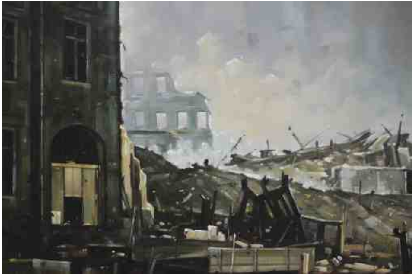
Feuersturm Kassel 2017 | Öl/Lw. | 40 x 60 cm