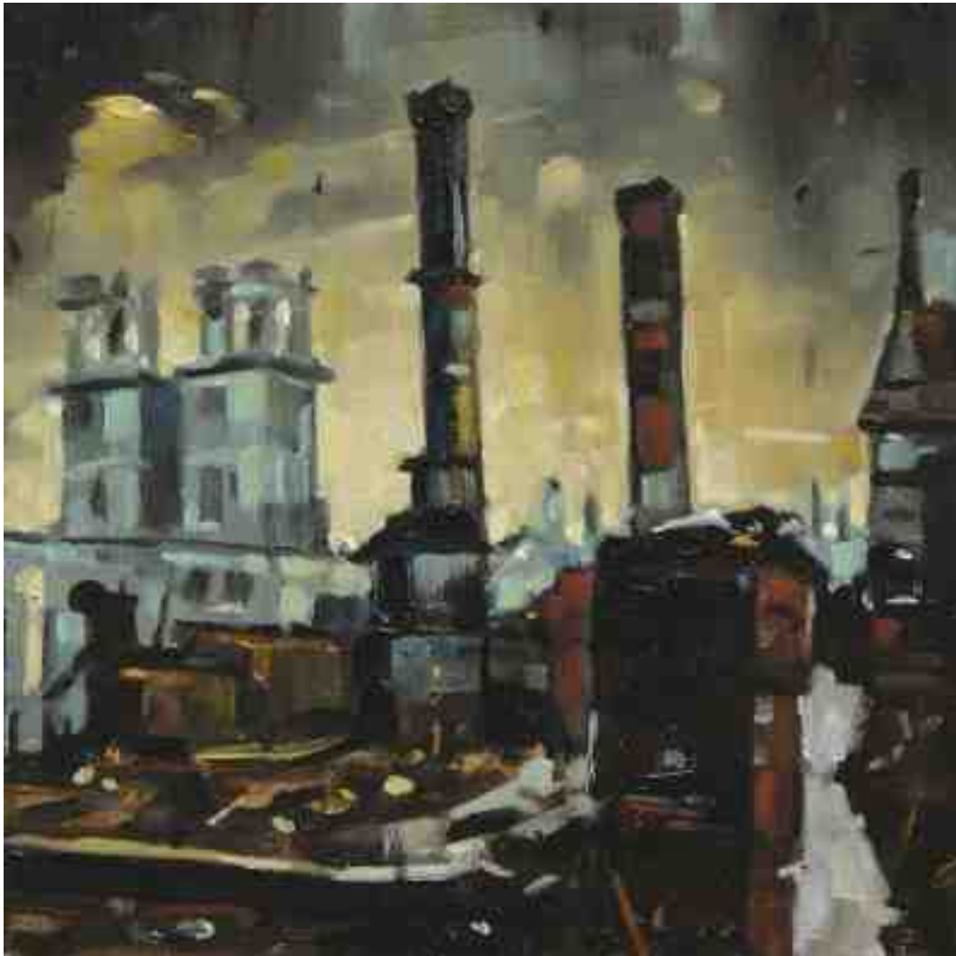
Feuersturm II Kassel 2017 | Öl/Holz | 15 x 15 cm