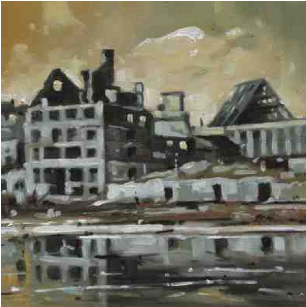
Feuersturm XII Kassel 2017 | Öl/Holz | 15 x 15 cm