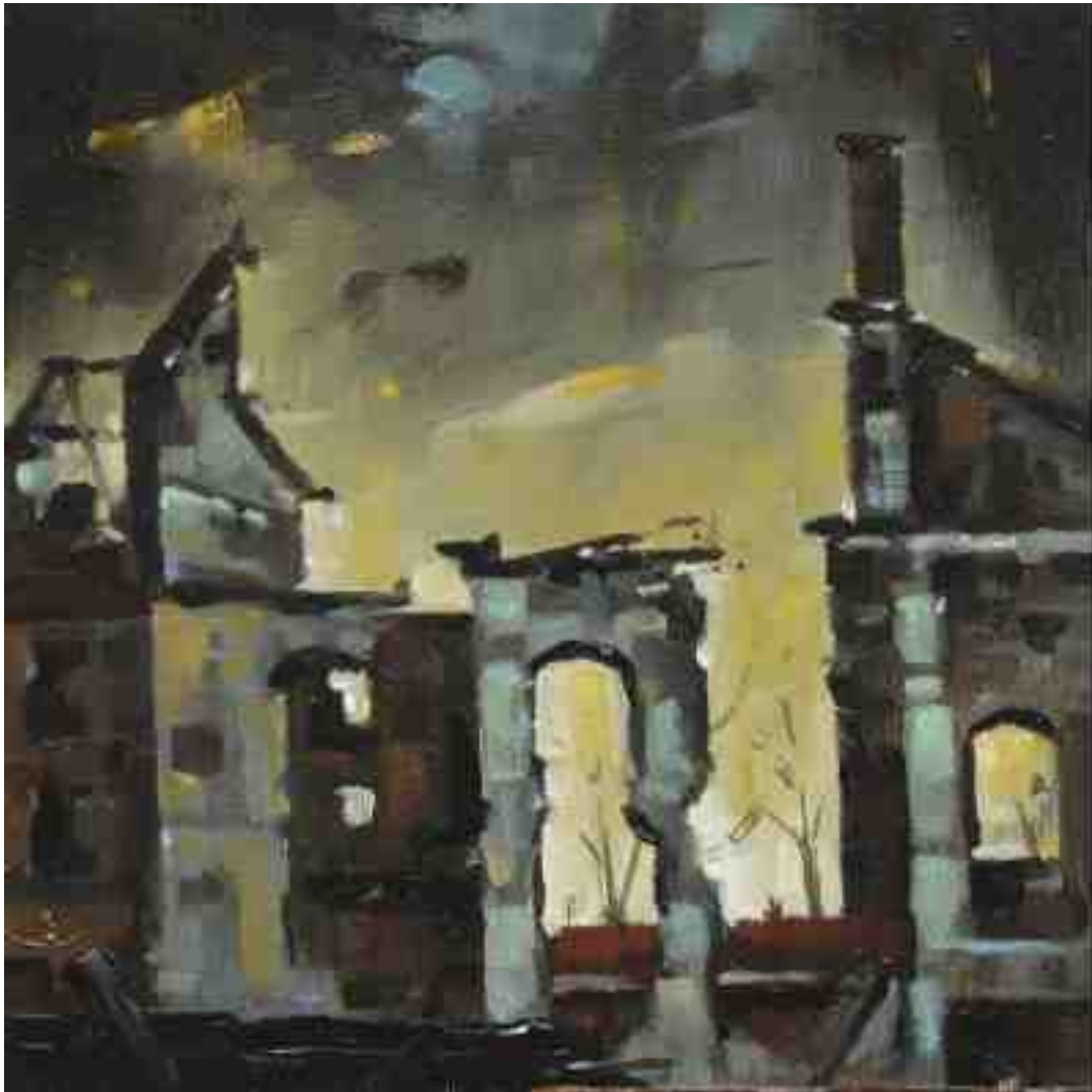
Feuersturm X Kassel 2017 | Öl/Holz | 15 x 15 cm