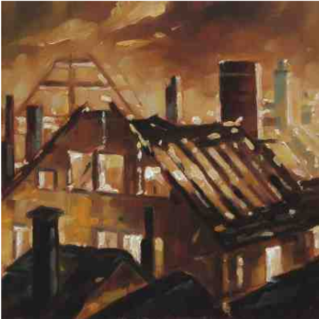
Feuersturm III Kassel 2017 | Öl/Holz | 15 x 15 cm