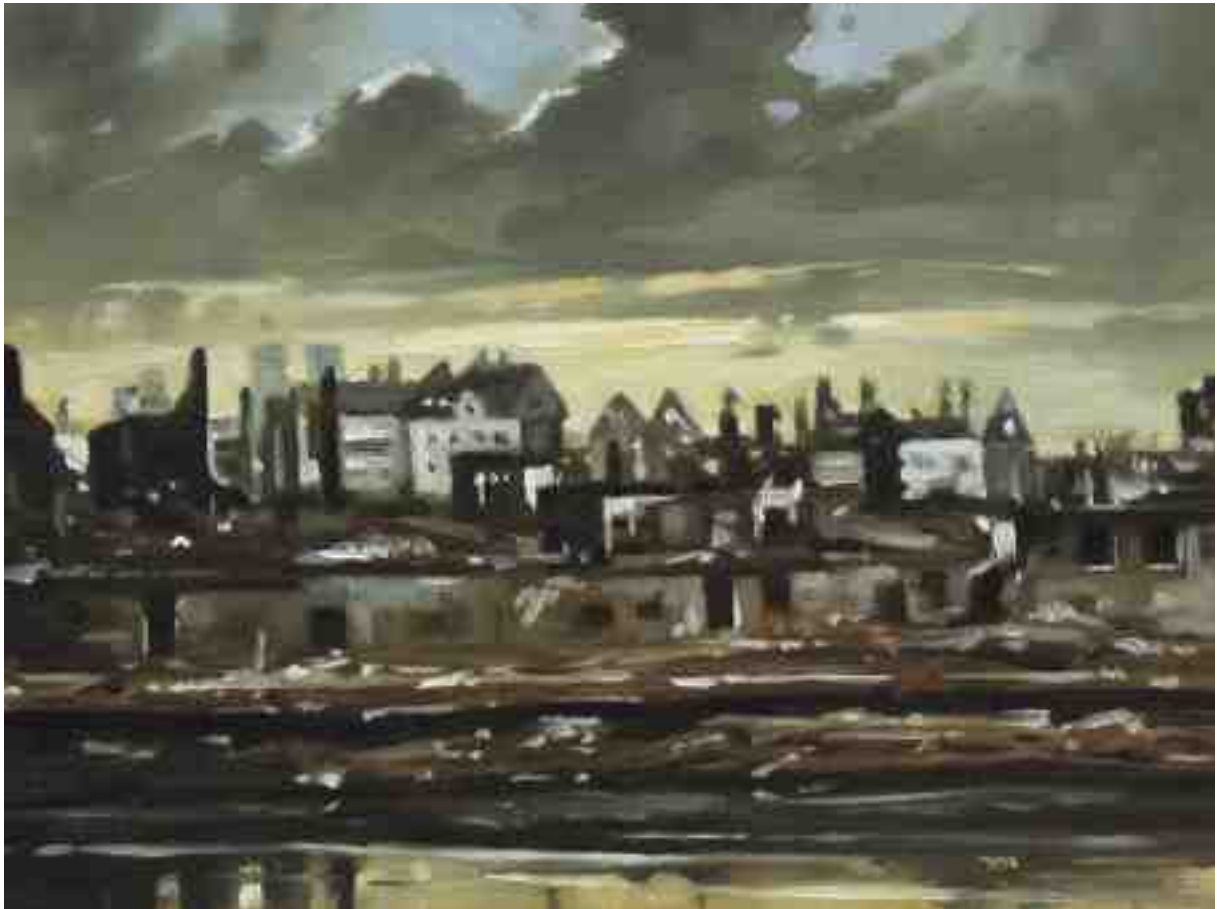
Feuersturm XXXIII Kassel 2017 | Öl/Holz | 18 x 24 cm