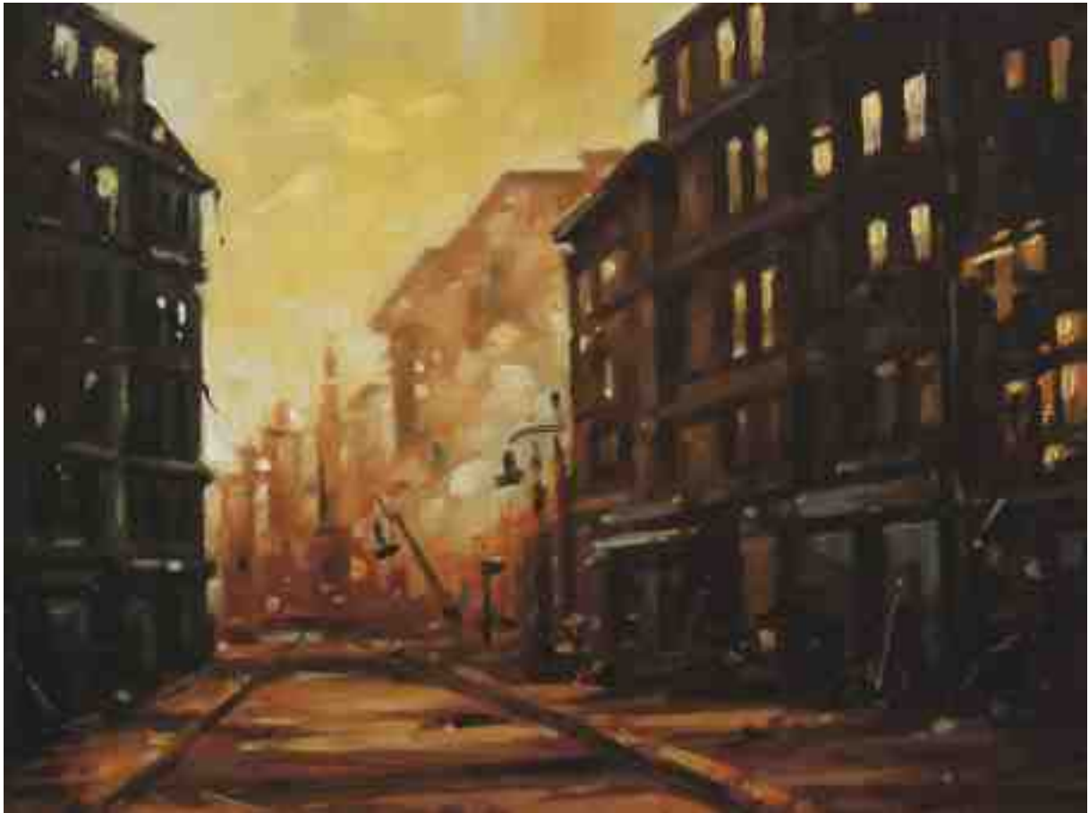
Feuersturm XXXVI Hamburg 2017 | Öl/Holz | 18 x 24 cm