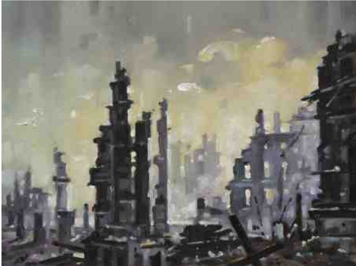
Feuersturm XXIII Dresden 2017 | Öl/Holz | 18 x 24 cm