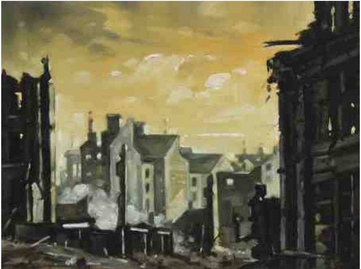
Feuersturm XXXI Hannover 2017 | Öl/Holz | 18 x 24 cm