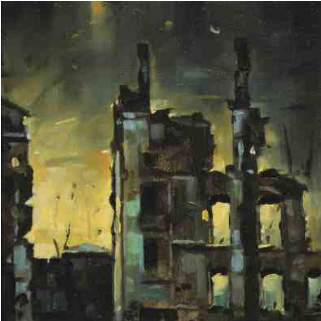
Feuersturm I Kassel 2017 | Öl/Holz | 15 x 15 cm