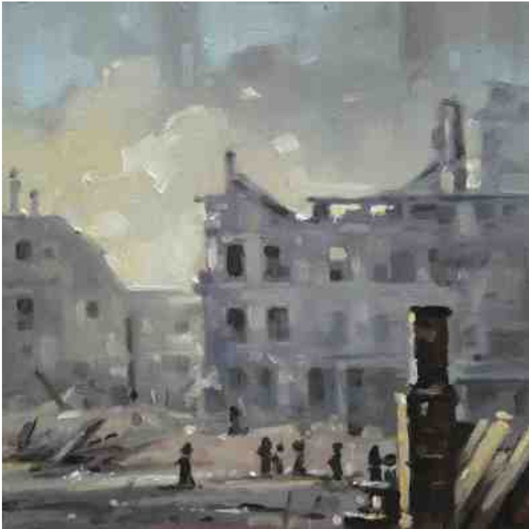
Feuersturm XVII Kassel 2017 | Öl/Holz | 15 x 15 cm